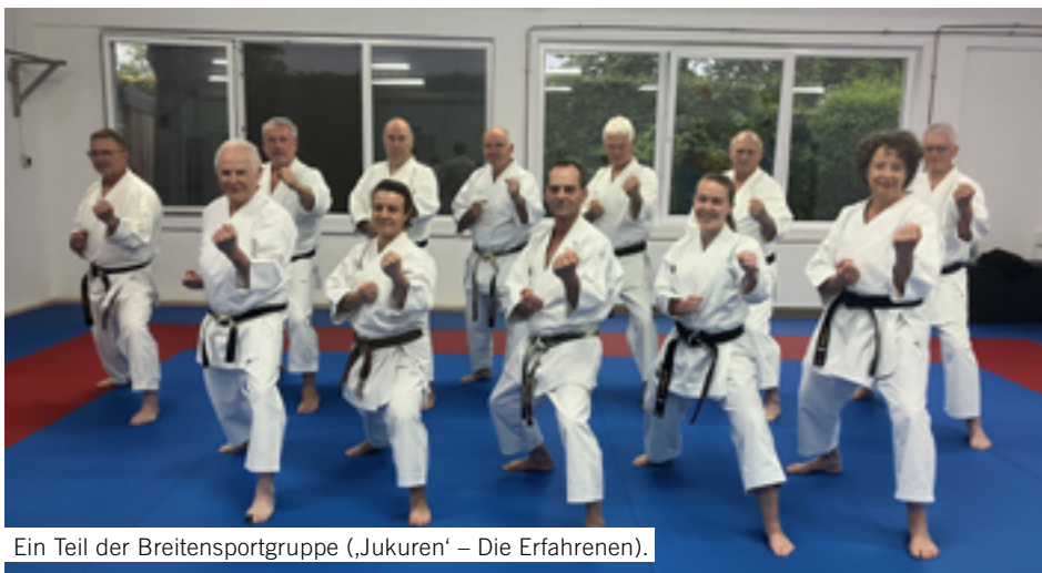
Ein Teil der Breitensportgruppe („Jukuren“ – Die Erfahrenen).