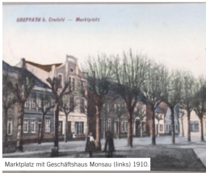
Marktplatz mit Geschäftshaus Monsau (links) 1910.