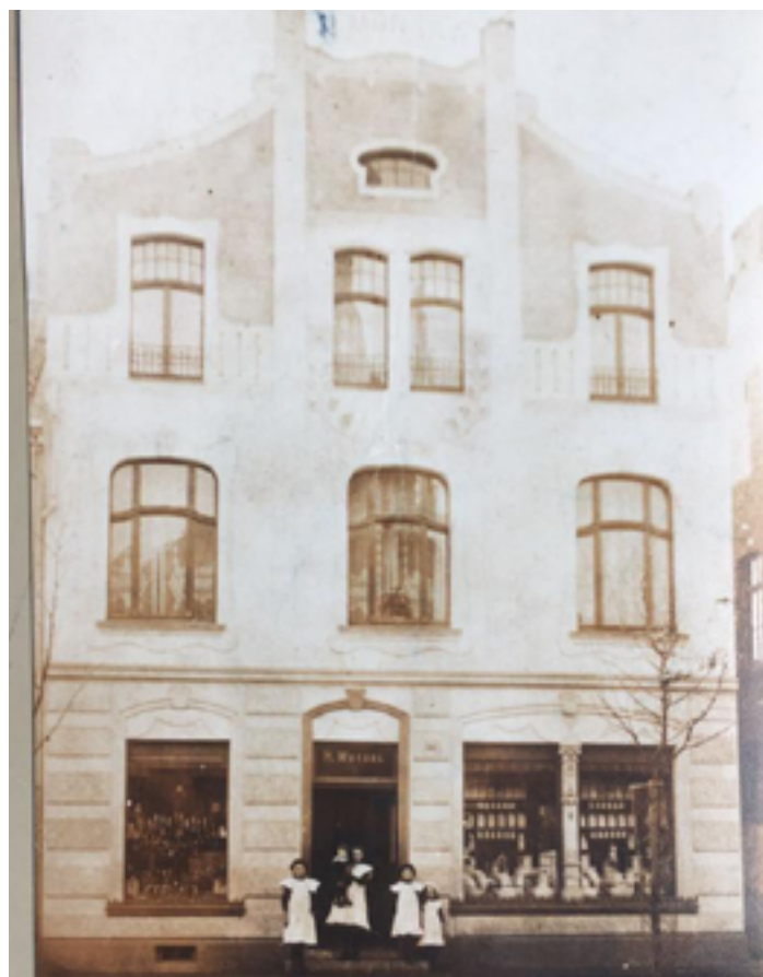
Geschäftshaus Monsau nach Umbau 1901 (unten).